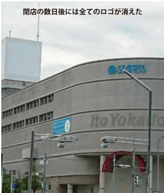
閉店の数日後には全てのロゴが消えた